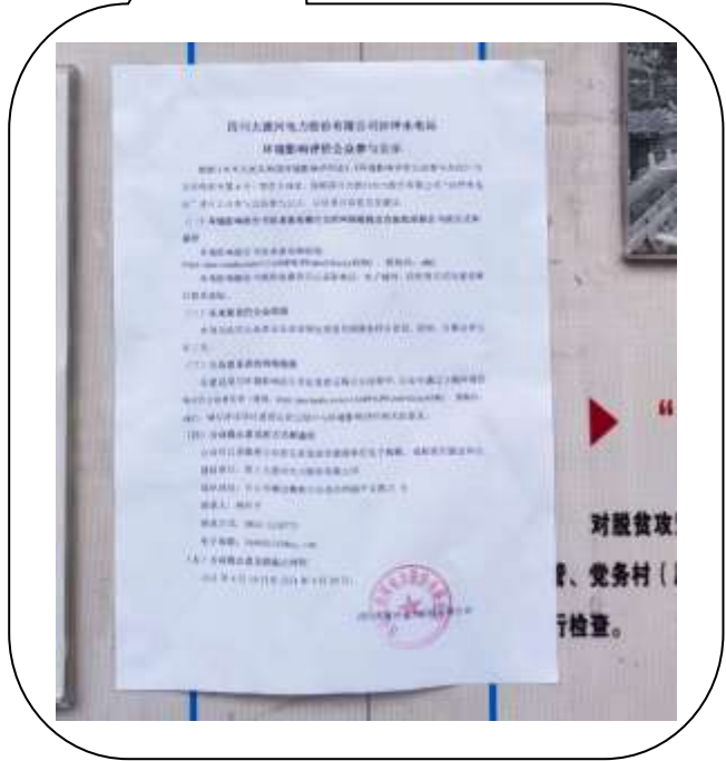
图 3-4 现场公示