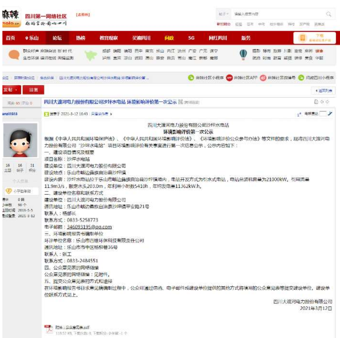
图 2-1 项目第一次公示网络公开截图

( https://www.mala.cn/thread-16113441-1-1.html )对《四川大渡河电力股份有限公司沙坪水电站环境影响评价》进行了第一次公开，公开内容见下图：