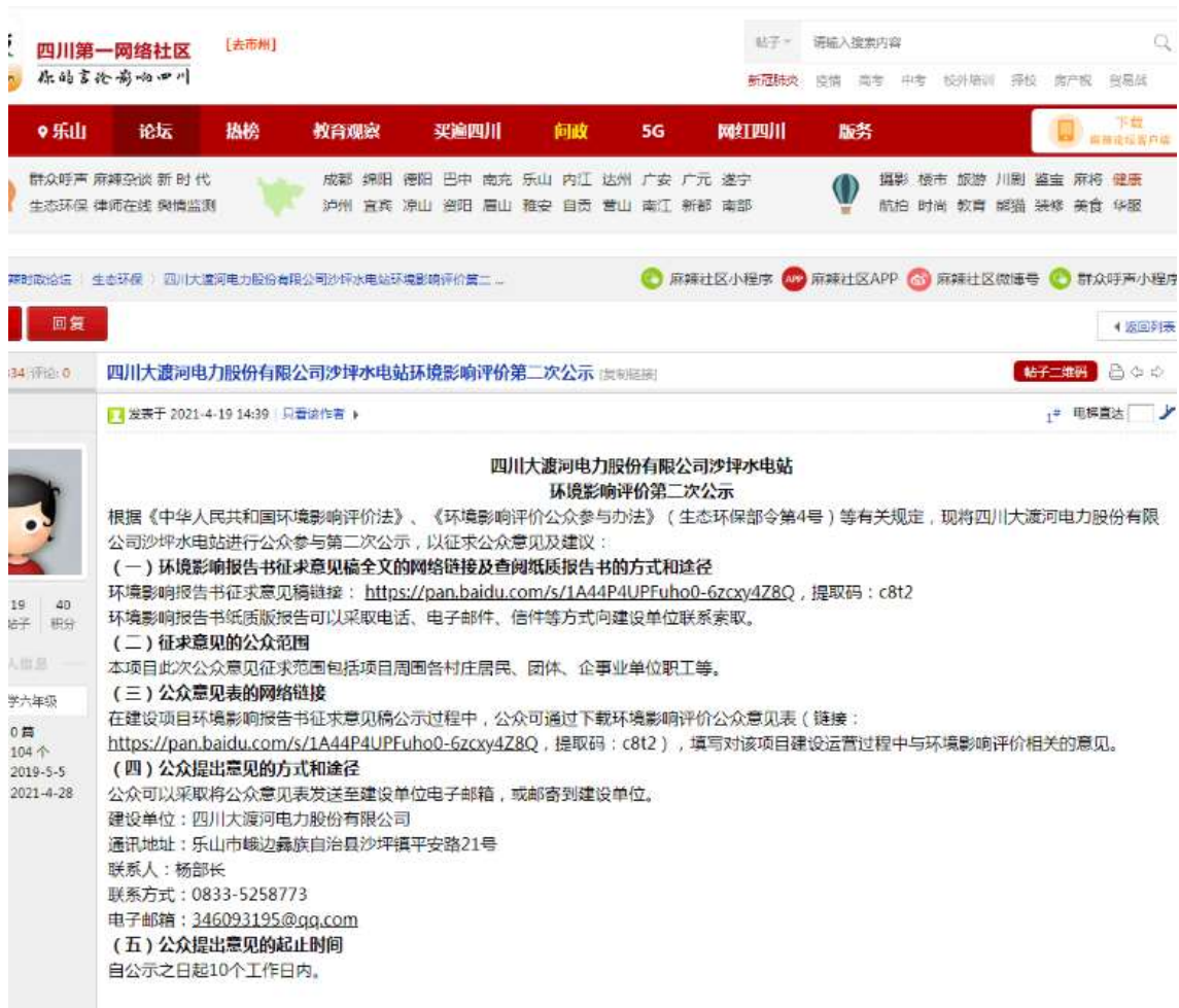
图 3-1 第二次网上公示截图