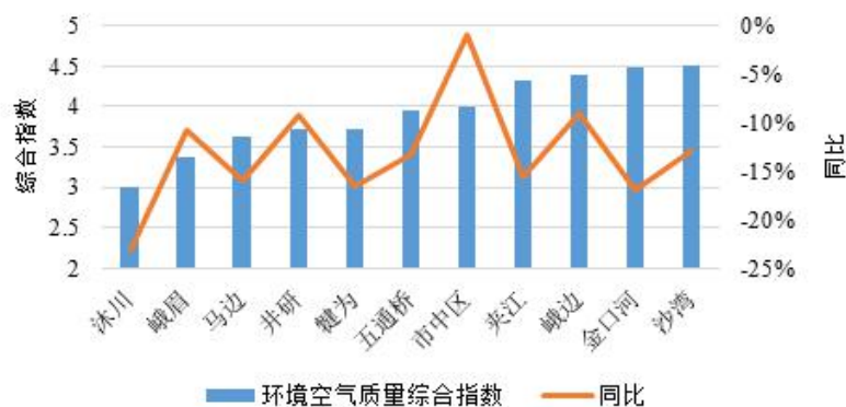
图3-2 2019年乐山市各县（区、市）环境空气质量综合指数排名情况

2019年，乐山市11个县（区、市）的环境空气质量综合指数在3.00—4.50之间，最高为沙湾区，最低为沐川县。同比，所有县（区、市）的环境空气质量综合指数均不同程度下降。