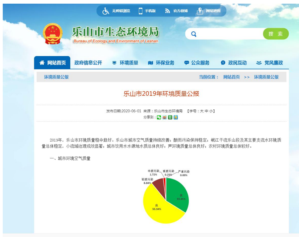
图 3-1 《乐山市 2019 年环境空气质量》网页截图

2019年乐山市全市环境空气质量平均优良天数比例为89.2%，其中优33.9%，良55.3%，同比上升7.7个百分点。