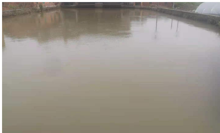
图2-4 压力前池现状图

压力前池大致呈矩形，池身总长 43m，宽 14m，渐变段长 12m。前池压力墙顶高程为 385.85m，原正常水位 385.0m，底板高程 382.5m。前池末端设进水室，水流经过拦污栅和进水闸进入水轮发电机。