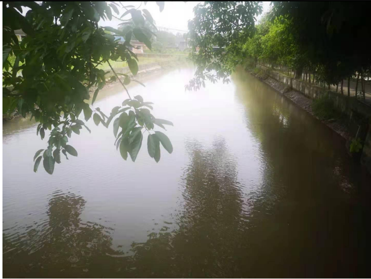
图2-3 引水渠道现状图