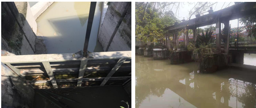
图 2-2 首部枢纽现状图

取水坝为闸坝，坝高 7m，坝长 35m，宽 9m，共有 5 孔闸门，包括 4 孔泄洪闸和 1 孔冲砂闸，泄洪闸孔宽 5.4m，冲砂闸孔宽 3.6m，闸门高 3.4m，库区正常水位为 385.83m。泄洪闸底板高程 382.5m，冲砂闸底板高程 382.0m，闸顶高程 387.0m。闸坝坝体为浆砌条石，基础置于砂卵石层上。