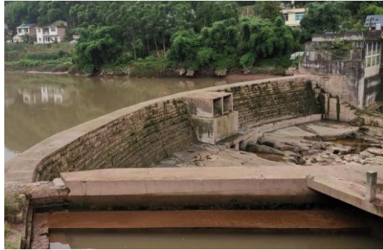
图 2.6-1 项目大坝现状

重力坝中间设置了 3 孔冲沙闸，其中 2 孔尺寸为 1.5m×1.5m (b×h)，1 孔尺寸为 1.5m×2.0m (b×h)。冲沙闸与进水室连成一个整体，进水室孔口尺寸为 3.655m×12.4m (b×h)，后接拦污栅、进水闸。