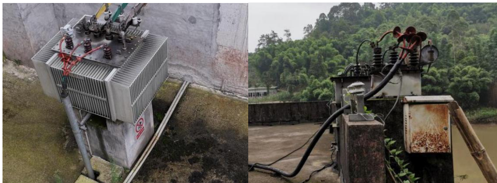
变压器 (2×500kw) 变压器 (320kw+160kw)