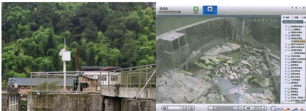
生态流量下泄口监控设施