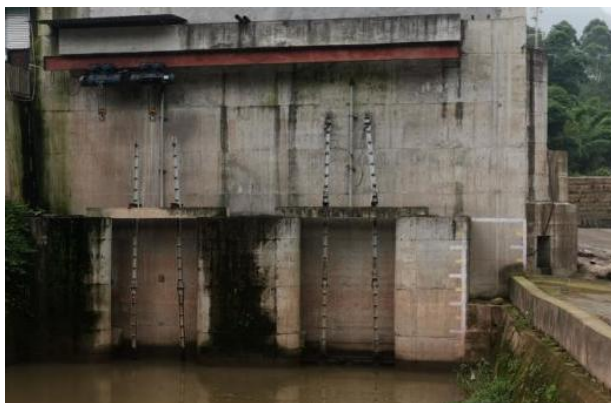
图 2.6-3 项目尾水渠