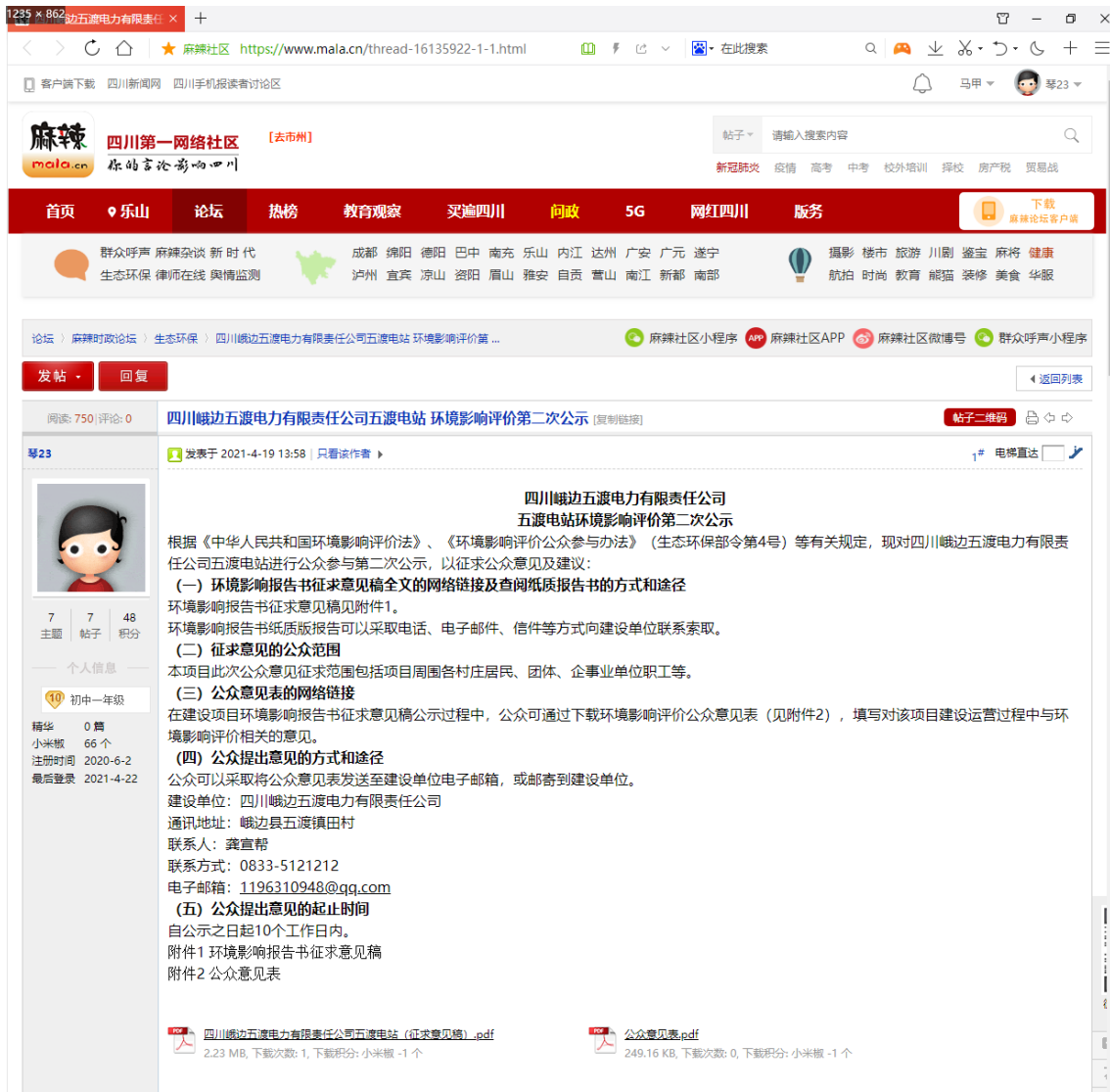
图 3-1 第二次网上公示截图