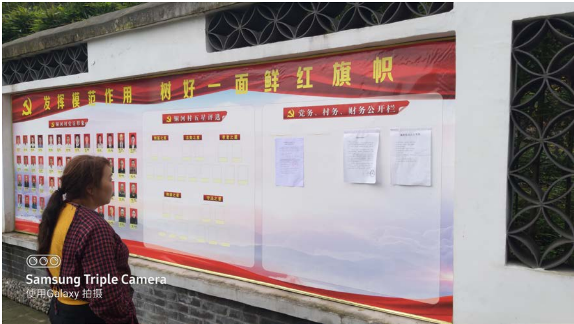
图 3-4 现场公示