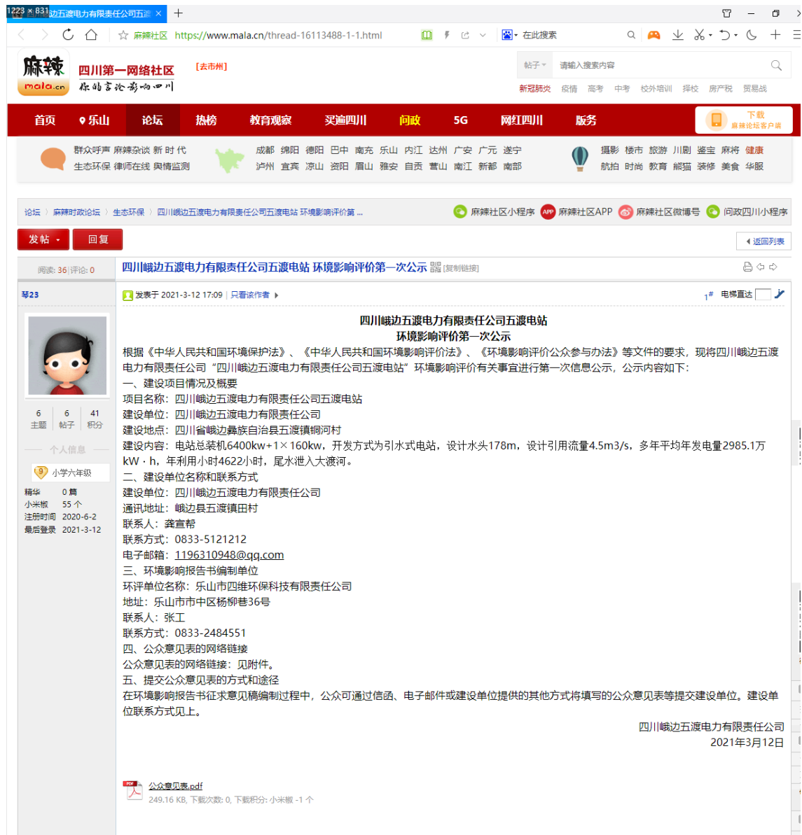
图 2-1 项目第一次公示网络公开截图

ml)对《四川峨边五渡电力有限责任公司五渡电站环境影响报告书》进行了公开，公开内容见下图：