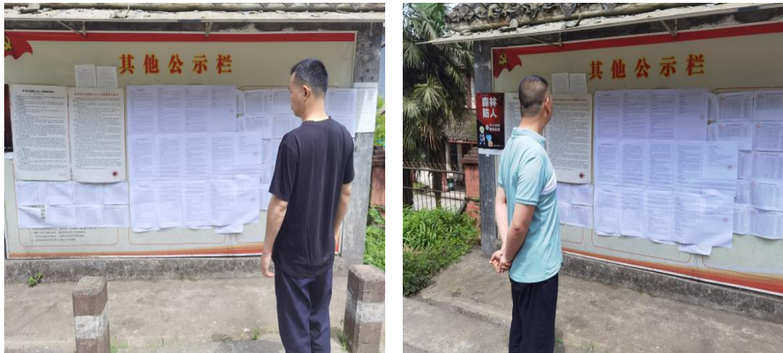
图3-4 张贴公告公示情况