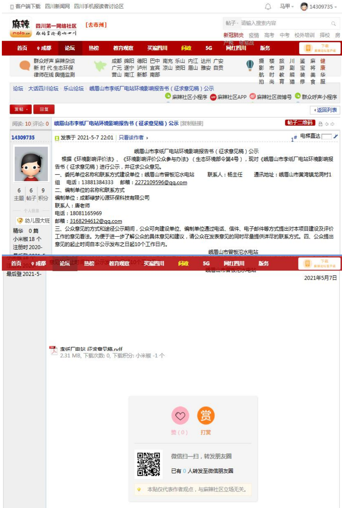
图3-1 项目征求意见稿网上公示截图