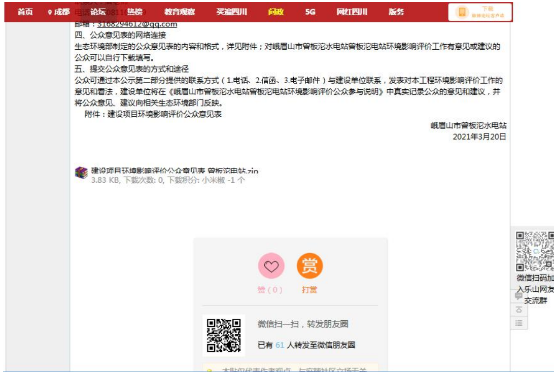
图2-1 电站第一次环境影响评价信息公开公示截图