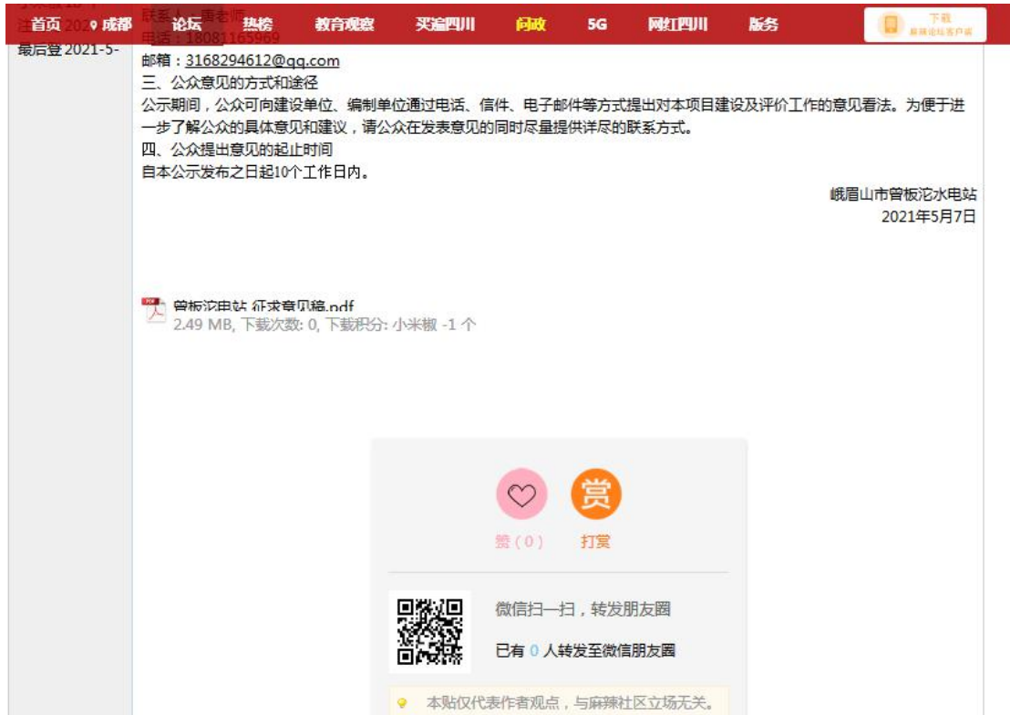
图3-1 项目征求意见稿网上公示截图