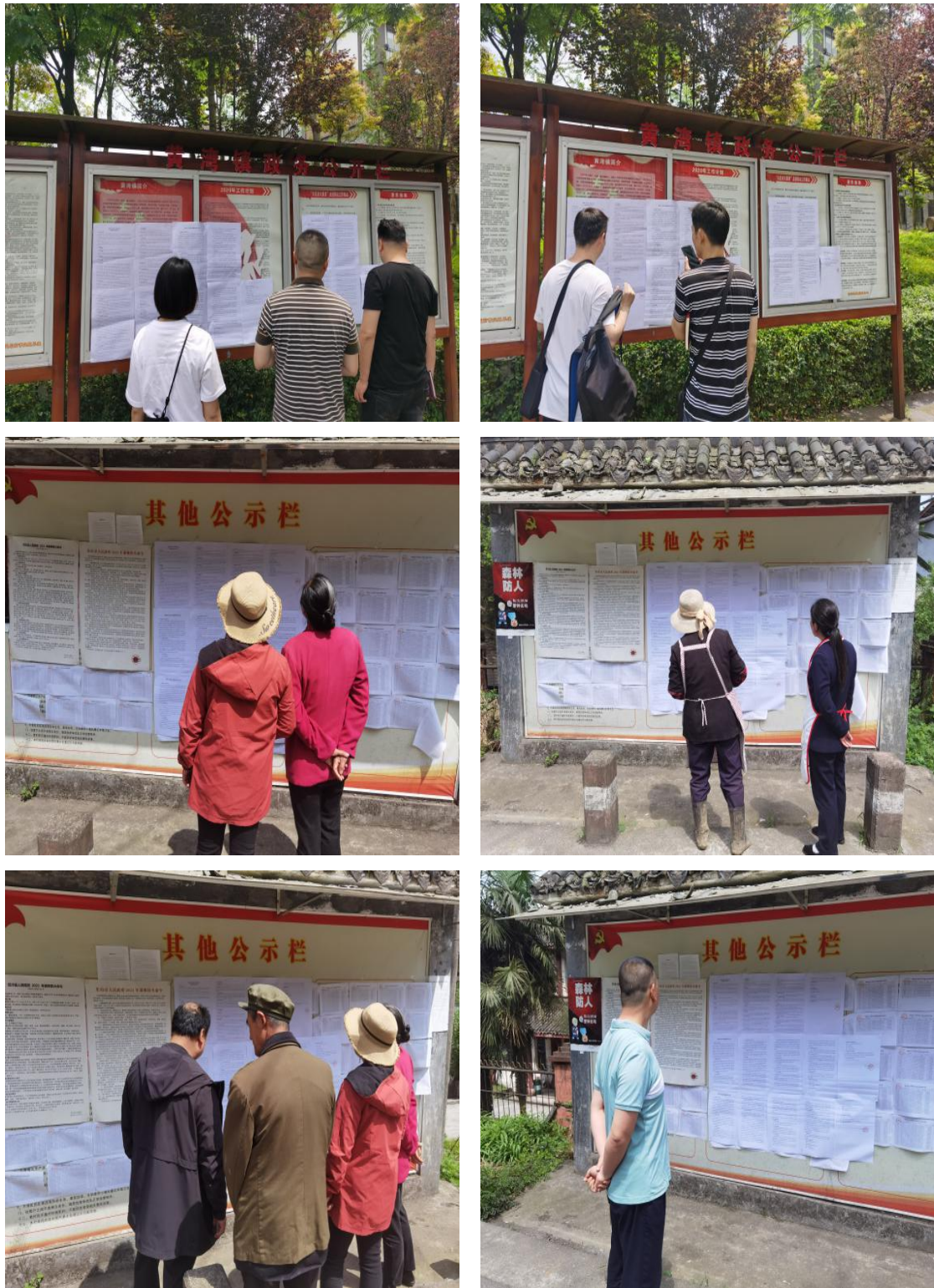
图3-4 张贴公告公示情况