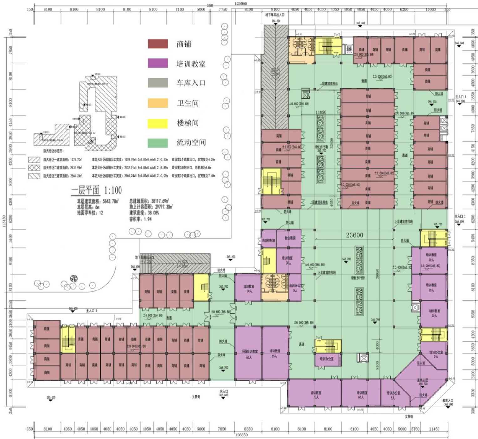
原批准方案一层平面图