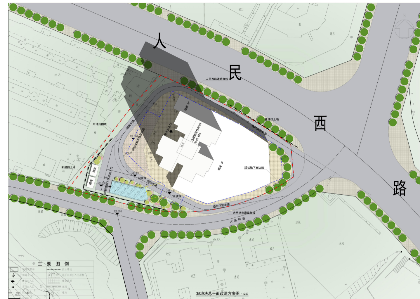
调整后近期改造总平面图