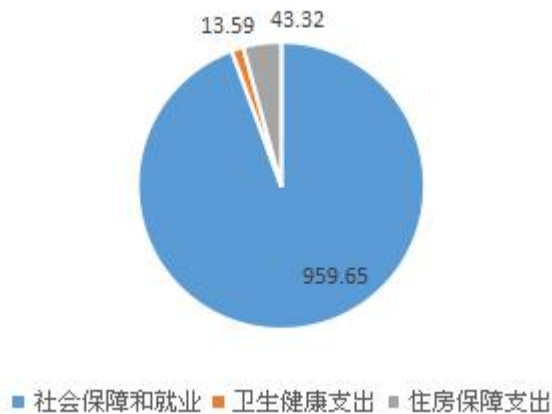
一般公共预算财政拨款支出决算结构图