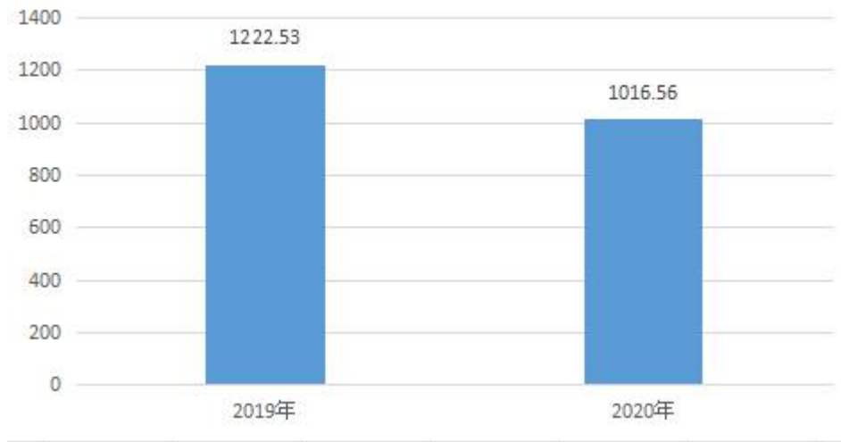
一般公共预算财政拨款支出决算变动情况表