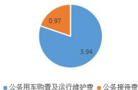
三公”经费财政拨款支出结构图

1. 因公出国（境）经费支出 0 万元，完成预算 0%。全年安排因公出国（境）团组 0 次，出国（境）0 人。因公出国（境）支出决算比 2019 年增加 0 万元，增长 0%。主要原因是 2020 年未安排因公出国（境）支出。