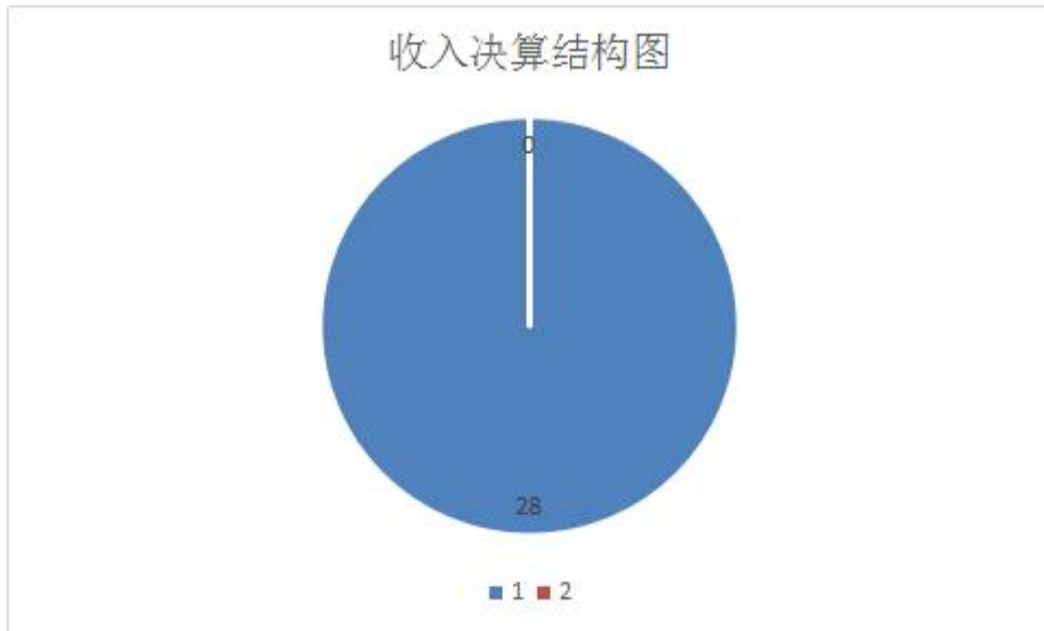
(图 2: 收入决算结构图) (饼状图)