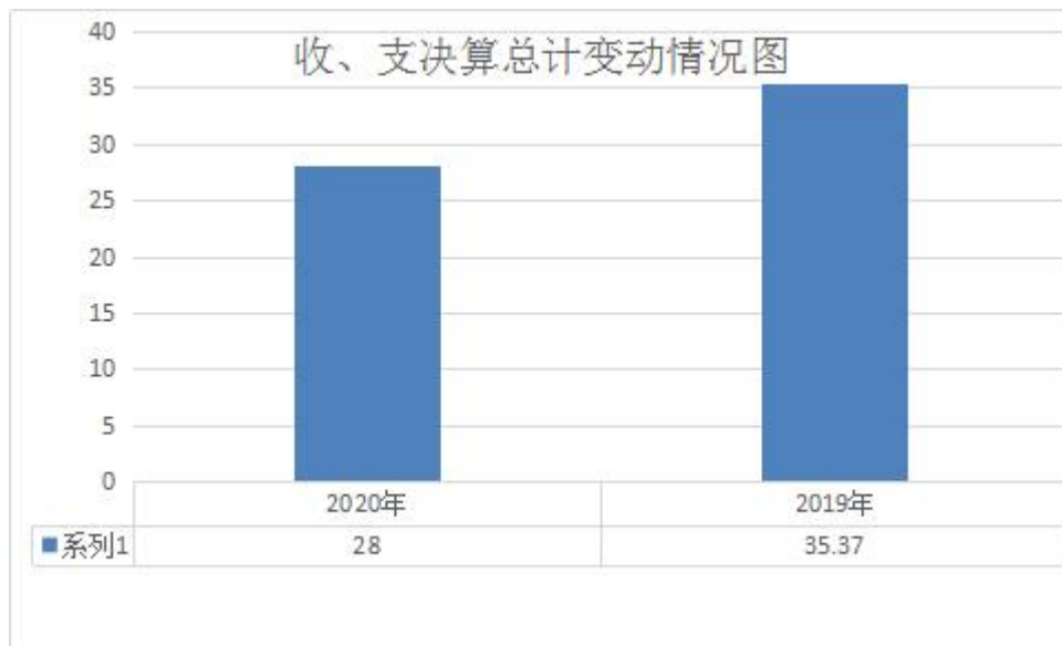
(图 1: 收、支决算总计变动情况图) (柱状图)

2020 年度收、支总计 28 万元，与 2019 年 35.37 万元相比，收、支总计减少 7.37 万元，降低了 20.8%。主要变动原因是加强内部管理。