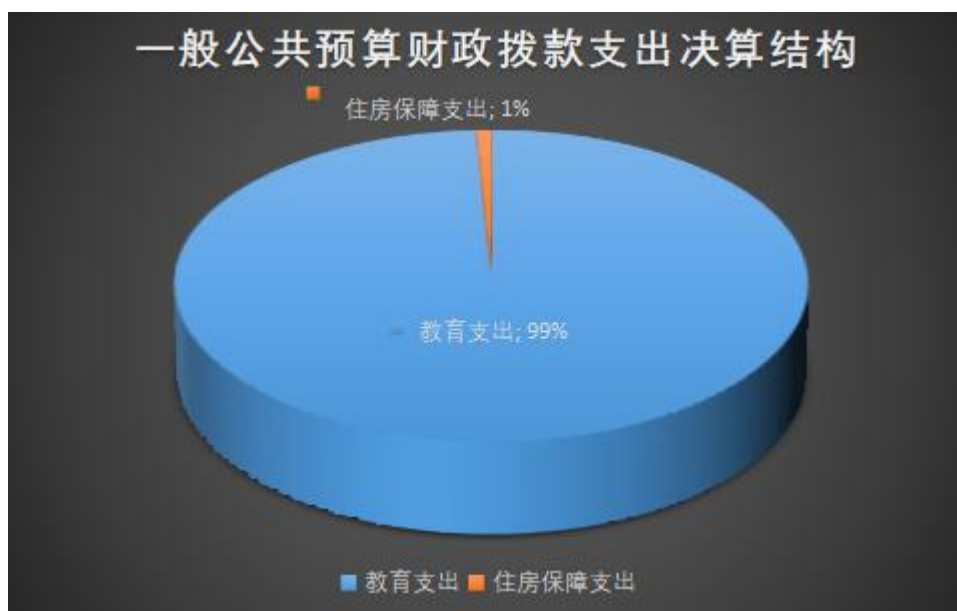
(图 6: 一般公共预算财政拨款支出决算结构)

2023 年度一般公共预算财政拨款支出 3211.49 万元，主要用于以下方面:教育支出 3185.49 万元，占 99%; 住房保障支出 26.01 万元，占 1%。