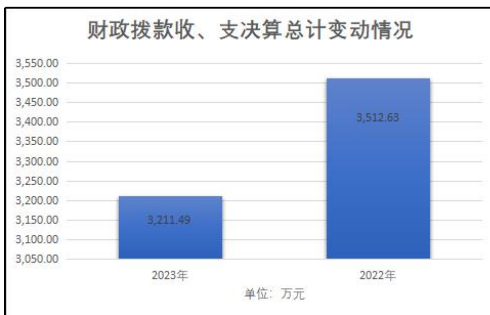
(图 4: 财政拨款收、支决算总计变动情况)

2023 年度财政拨款收、支总计均为 3211.49 万元。与 2022 年度相比，财政拨款收、支总计各减少 301.14 万元，下降 9%。主要变动原因一是教师人员较上年度有所减少 12 人，导致人员经费相应减少；二是项目经费减少，导致项目经费收入减少。