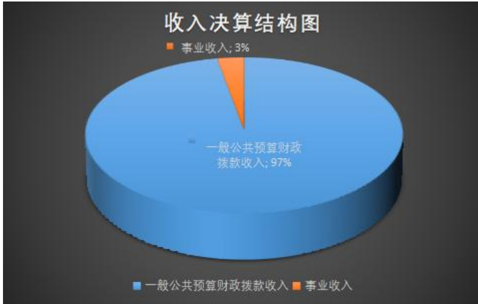
(图 2：收入决算结构图)