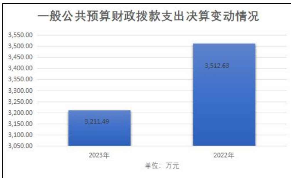
(图 5: 一般公共预算财政拨款支出决算变动情况)